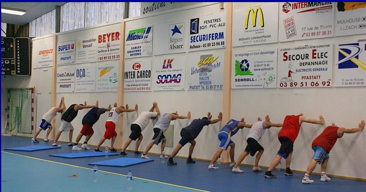
Il faut souffrir pour être en forme le jour J. Acte 1.